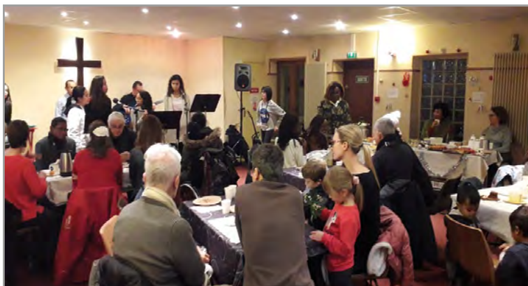
La création d'une nouvelle communauté à Créteil est portée ensemble par plusieurs partenaires protestants.

Pour les années à venir, leur engagement ecclésial sera sur Créteil et non plus dans leur paroisse d'origine.