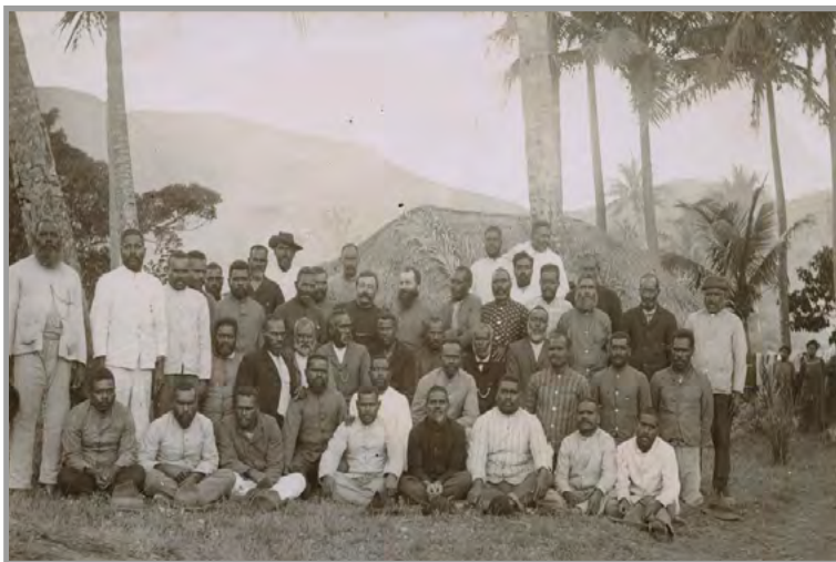
Entre Maurice Leenhardt et les pasteurs kanak, qui est le converti ?

Le missionnaire se découvre alors dans sa relation à Dieu à égalité avec ses frères et sœurs : « il sait ses frères encore ignorants de leur surnaturelle identité, mais ne doit-il pas avouer que, pécheur, il méconnaît lui-même ce qu'il se sait être, comme eux, fils du même Père, aimé de Dieu ? Religieusement, ce sont des pauvres. Ne l'est-il pas lui aussi 24 ? » Ainsi la distance culturelle qui le maintenait, semble-t-il, irrémédiablement à distance s'estompe-t-elle à partir du moment où il prend conscience et accepte, dans un processus de transformation intérieure, de faire partie, sans hiérarchie, de la communauté universelle des enfants de Dieu. Cette conversion, affirme de Certeau, agit comme une véritable révélation de soi-même : « voici que s'éveille en eux [le missionnaire et ses interlocuteurs] quelque chose de plus précieux : c'est leur propre personne ; elle sort de la lumière ; elle se manifeste dans le langage de la communion, qui annonce ce langage chrétien 25 ».