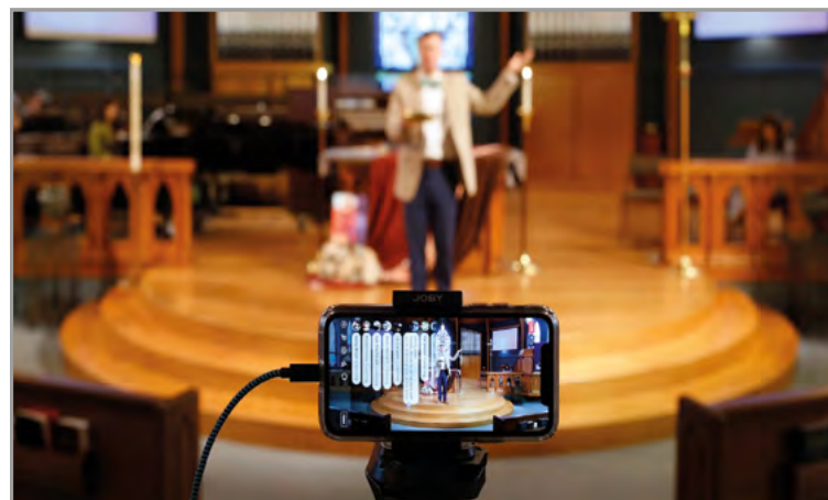
Création de supports multimédia, numérisation des échanges, usage des réseaux sociaux,... les nouveaux outils de l'évangélisation.