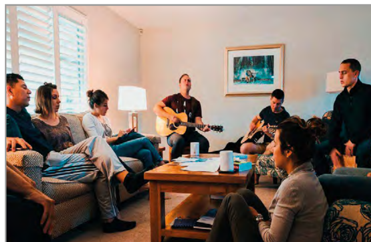
Les églises de maison : un autre modèle missionnaire.

devrait permettre aux points positifs suivants d'émerger :