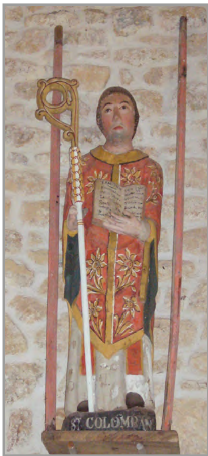
Saint Columban [Chapelle Saint Columban à Pluvigner].

Saint Columban, apôtre irlandais connu pour avoir fondé en Europe au cours des VI e et VII e siècles de nombreux monastères.