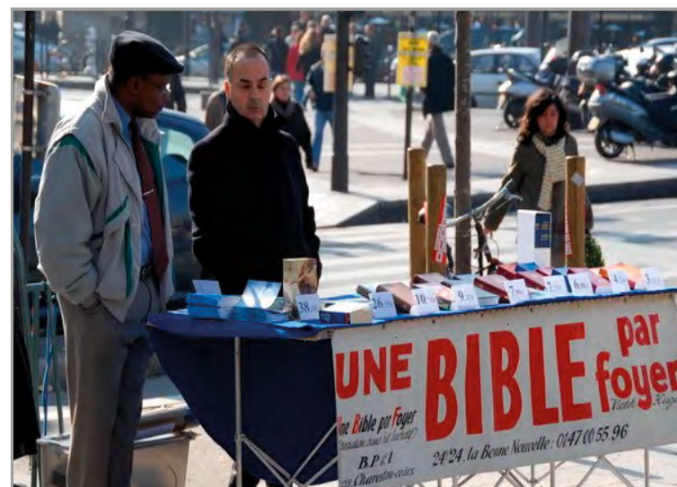
Stand biblique de rue.