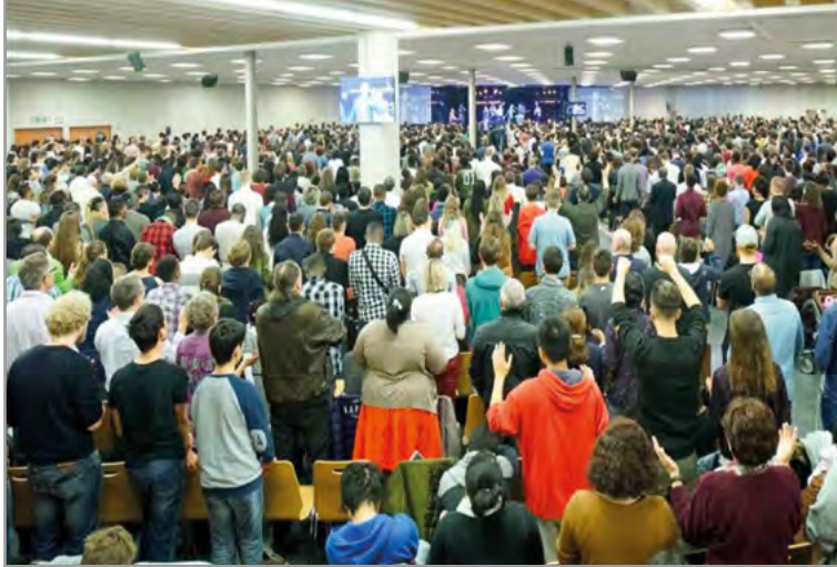
La Porte Ouverte à Mulhouse, un supermarché converti en Église.