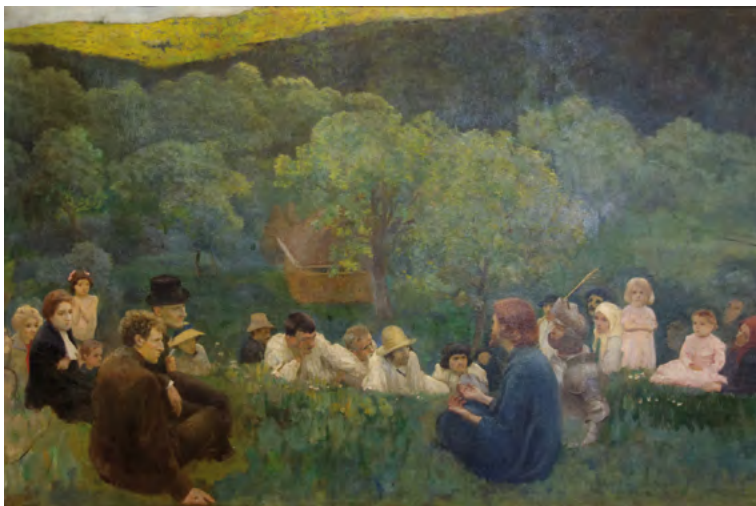
Károly Ferenczy, Le Sermon sur la montagne, 1896, Galerie nationale hongroise, Budapest