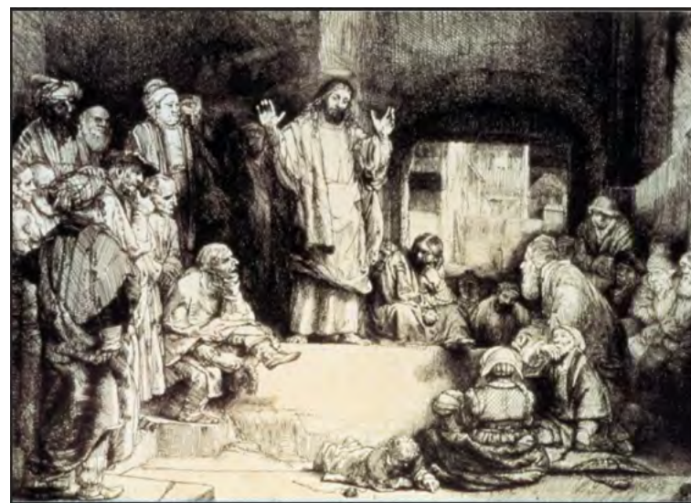
Rembrandt, Le Christ prêchant, vers 1652 (Rijksmuseum, Amsterdam)

Au XX e siècle, en 1920, le patriarche orthodoxe de Constantinople ouvre le débat sur le prosélytisme en se plaignant des pratiques catholiques et évangéliques en « terre orthodoxe » 11 . Du côté œcuménique, lors des réunions préliminaires de Foi et constitution et du Christianisme pratique, au cours de la même année 1920, la question du prosélytisme est également soulevée. Suite à la création du COE en 1948, dans une dynamique de mise en commun des idées et des confessions, la réflexion sur le prosélytisme s'intensifie.