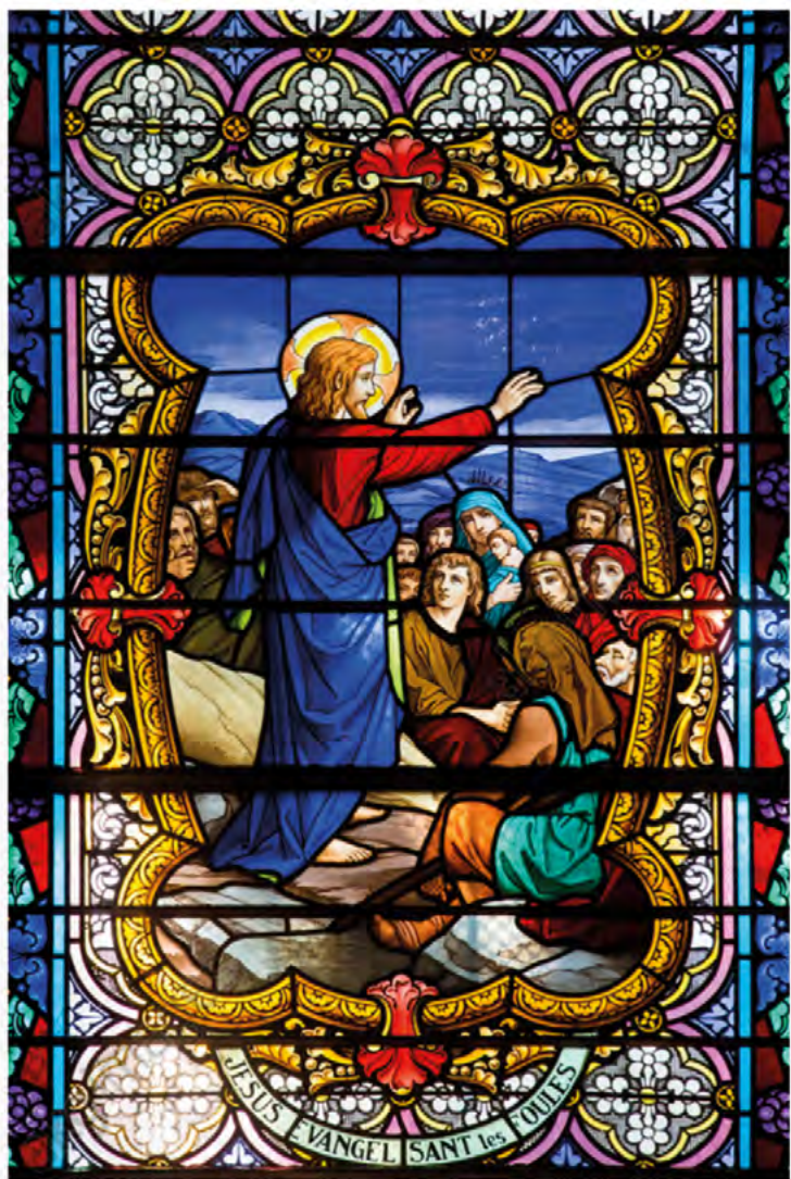
Jésus évangélisant les foules, vitrail, 20 e s., Cervens, Hte-Savoie, Église Saint-Étienne

et futurs», par « les contraintes légales et culturelles et l'inertie institutionnelle qui entravent le changement », ainsi que par « le fardeau des bâtiments ecclésiaux ». Cet affaiblissement constaté est envenimé par la distribution des moyens humains et financiers opérée au niveau national sans prise en compte de la croissance