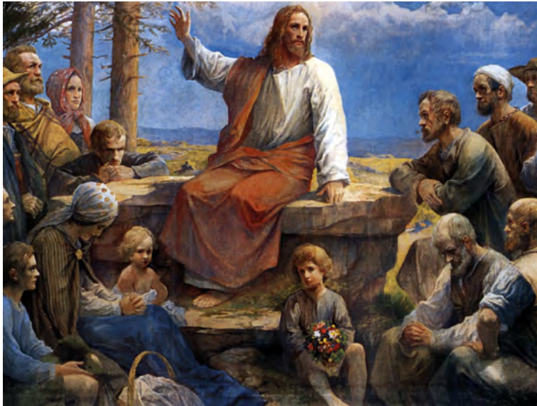
Rudolf Yelin, Le Sermon sur la montagne , vers 1912, Eglise évangélique de Reinerzau, Forêt Noire, Allemagne

44 ponts, des liens, des ouvertures. L'œcuménisme, ou le dialogue interreligieux, loin d'être une tactique (une continuation sournoise de la guerre des religions par d'autres moyens) ou une simple et quelque peu ennuyeuse politesse spirituelle, est œuvre de paix : il nous apprend à vivre avec nos différences, écouter et apprendre de l'autre, argumenter aussi, voire à l'occasion s'opposer à lui, dans le respect, quand ses convictions ou comportements menacent le vivre ensemble ou un partage entre égaux. Le dialogue devient alors un outil pour surmonter difficultés et hésitations, où chacun aide l'autre dans sa recherche spirituelle en vue du maintien d'un « patrimoine spirituel de l'humanité » aussi large que possible 12 .