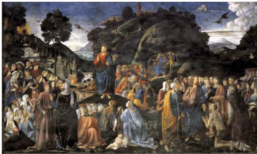
Cosimo Rosselli

bué à le mettre en lumière. L'entrée non sollicitée de missionnaires protestants dans les communautés orthodoxes au Moyen-Orient s'étend sur plus d'un siècle et demi. Comme l'a noté Norman A. Horner, il est possible que ce prosélytisme ait émergé suite aux échecs rencontrés par les missionnaires protestants dans leurs efforts pour évangéliser les musulmans. Ceux-ci se seraient alors tournés vers diverses communautés orthodoxes déjà présentes et établies dans la région 14 . Un certain nombre d'études sur le sujet ont été entreprises par le Conseil des Églises du Moyen-Orient (CEMO) et par des membres individuels du Conseil 15 .